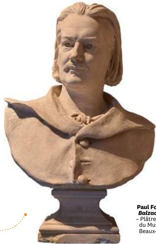
Paul Fournier, Balzac - 1888 - Plâtre. Dépôt du Musée des Beaux-arts de Tours.

Ce buste préparatoire est l'un des rares témoignages du Monument à Balzac que Paul Fournier réalise pour la Ville de Tours en 1889, œuvre en bronze descendue de son socle pour être fondue le 2 février 1942. Le monument représentait Balzac assis, drapé dans sa robe de chambre, dans la continuité de l'iconographie des monuments aux grands écrivains. Le buste est imprégné de références au buste réalisé par David d'Angers.