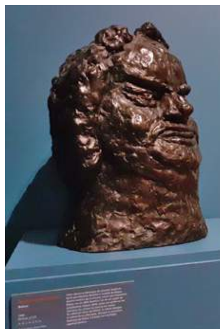
Martine Martine, Balzac - 2006, bronze et 2011, estampes. Collections du Musée Balzac, Saché