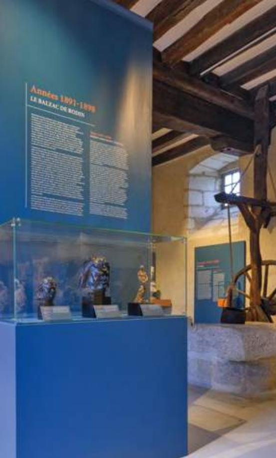
Vue de la salle Rodin avec des éditions en bronze d'études de têtes d'Auguste Rodin.

(2,75 m de haut). Présentée au Salon de 1898, l'œuvre reçoit un accueil très mitigé. La Société des gens de lettres estime que l'œuvre de Rodin ne ressemble pas assez à Balzac pour servir de monument à sa mémoire et refuse l'œuvre.