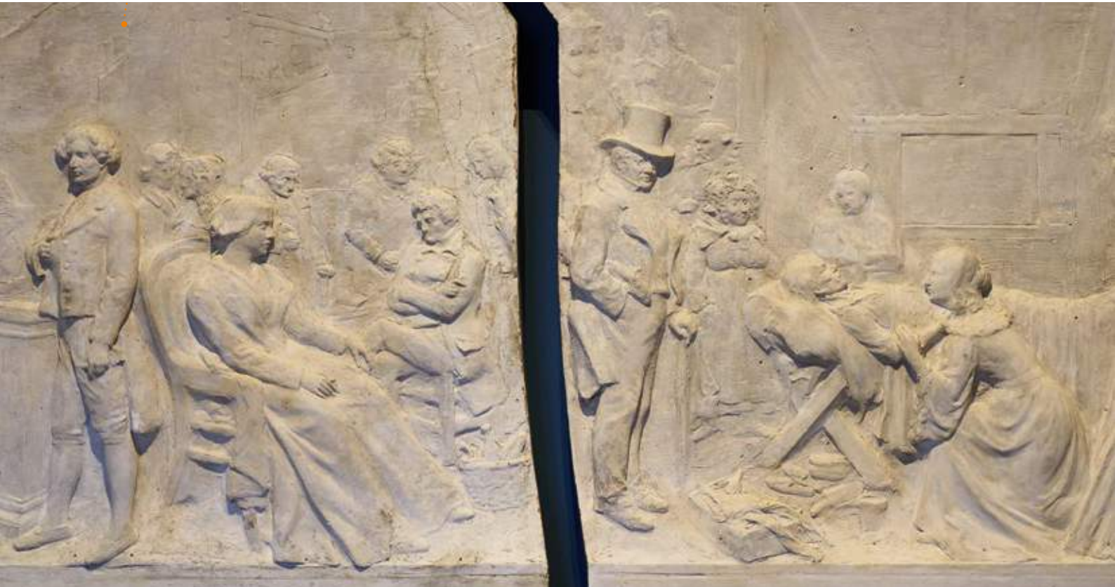
Anatole Marquet de Vasselot, La Comédie humaine - 1901 - Plâtre (fragments 1 & 2). Dépôt de la Maison de Balzac, Paris.

Anatole Marquet de Vasselot, dont le projet n'est pas retenu par la Société des gens de lettres en 1891, réalisera par la suite plusieurs sculptures en hommage à Balzac tel le monumental bas-relief en plâtre (6,60 m) présenté au Salon de la Société nationale des Beaux-arts de 1901. Deux des six fragments de ce bas-relief sont présentés au musée Balzac. Sur un fond de décors modelés en faible relief, plus d'une centaine de personnages de La Comédie humaine sont représentés sur trois plans. Ils évoluent sous le regard d'Honoré de Balzac assis, en train d'écrire.