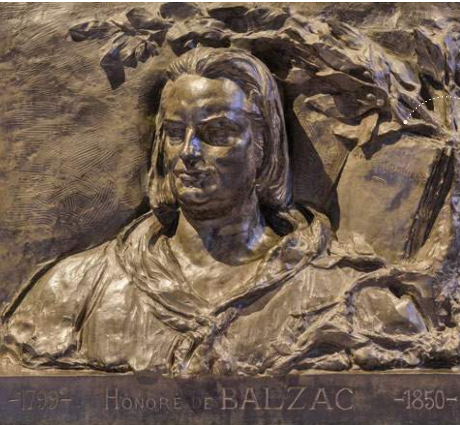
François Sicard, Balzac - 1899 - Bronze. Dépôt du Musée des Beaux-arts de Tours

Anciennement placée sur la façade de la maison natale de Balzac, cette œuvre a été commandée par le Comité du centenaire de Balzac, à Tours, en 1899. François Sicard, non retenu par la Ville de Tours dix ans plus tôt pour réaliser le monument confié à Paul Fournier, se place ici dans la continuité de ce dernier, reprenant le modèle du buste de David d'Angers et les attributs traditionnels de l'écrivain (robe de chambre, livre).